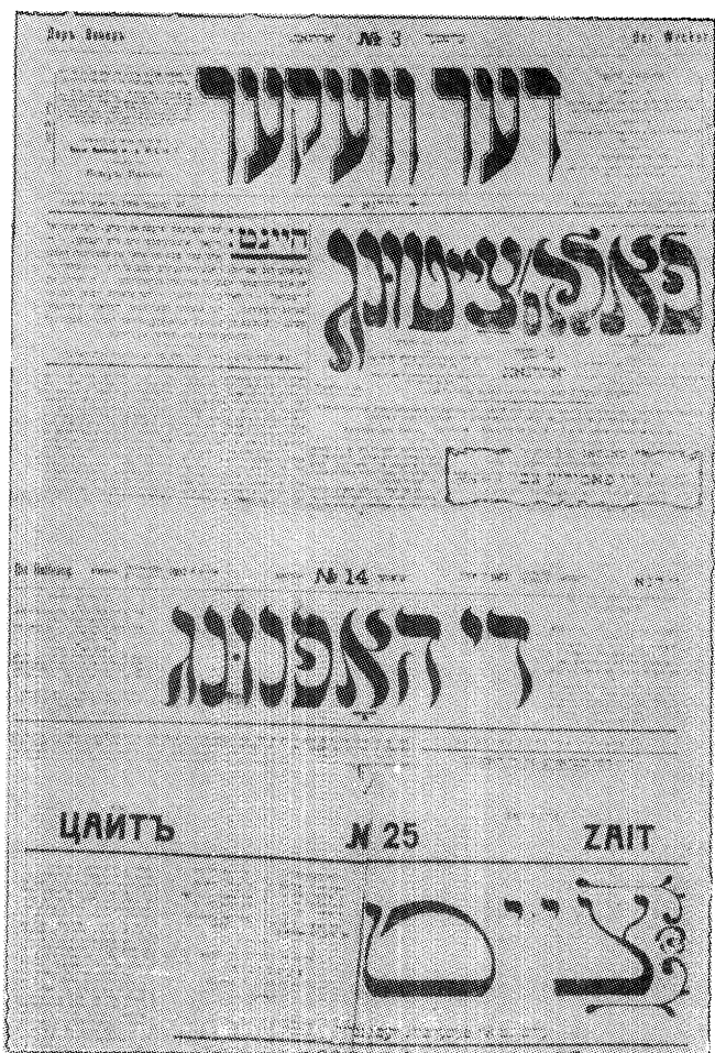
דער וועקער, פאלקס צייטונג, די האַפּנונג — דריי טעגלעכע צייטונגען פון בונד, דערשינען אין ווילנע 1906-1907. די צייט — אַ וואַכנבלאַט פון בונד, 1913-1914. דערשינען אין פעטערבורג.